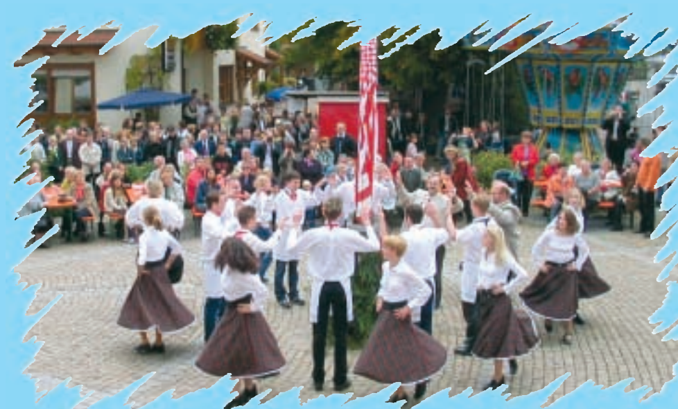
Kirchweih im Paradies

Interessieren Sie sich doch eher für Musik und Theater? Im Sommer locken zahlreiche Open-Air-Veranstaltungen rund um Weißenbrunn. Sie haben die Wahl! Von Goethes Faust bis Comedy, von Konzerten etablierter Opernstars und klassischen Orchestern bis hin zu Rock- und Pop-Konzerten wird Ihnen alles geboten!