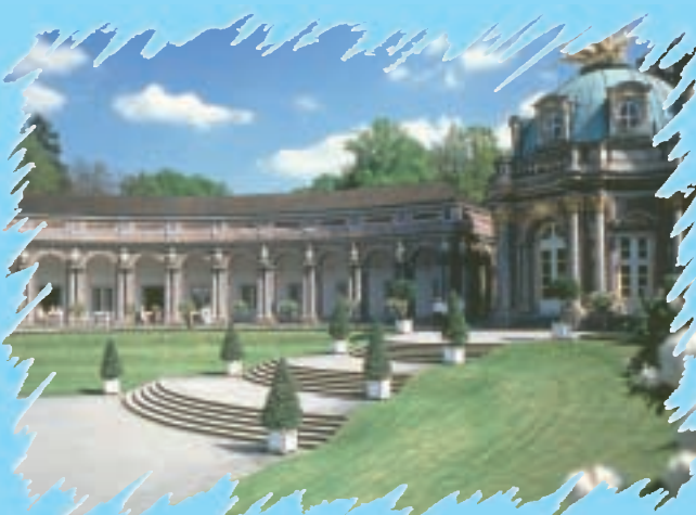
Bayreuth Sonnentempel, Eremitage

Auch Bayreuth ist von Weißenbrunn aus in wenigen Autominuten zu erreichen. Neben dem markgräflichen Opernhaus, das als schönstes Barocktheater Europas gilt, dem Richard-Wagner-Museum und der Parkanlage Eremitage zählt natürlich das berühmte Festspielhaus auf dem Grünen Hügel zu den Highlights eines jeden Bayreuth-Besuchs! Schauen Sie hinter die Kulissen einer der bedeutendsten Opernbühnen der Welt!