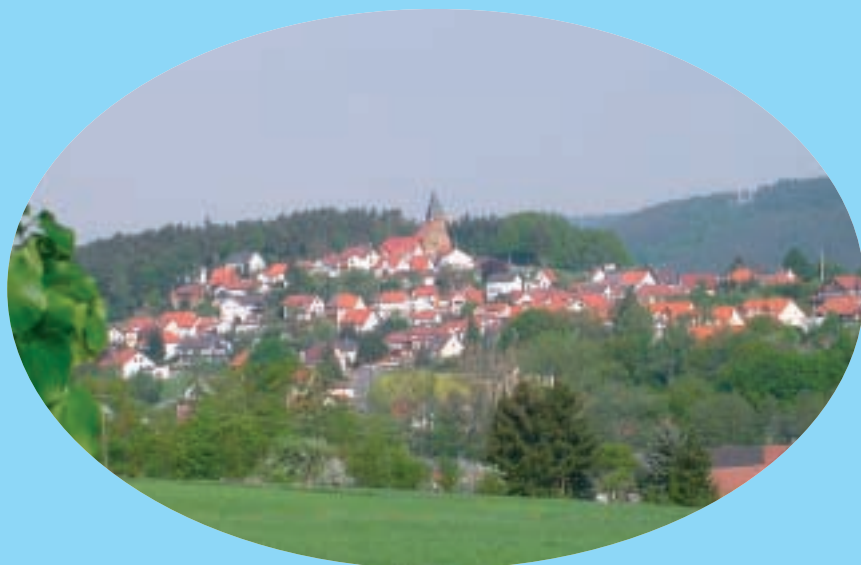
Gemeindeteile Thonberg und Reuth