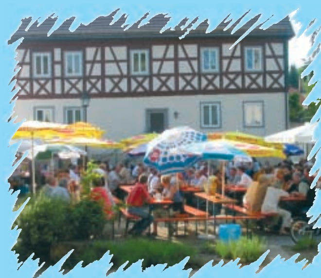
Fest auf dem Paradiesplatz

Tauchen Sie ein in die fränkische Lebensart. Erleben Sie unsere Dorffeste. Liebevoll organisiert von den örtlichen Vereinen sind beispielsweise unser Brauer- und Büttnerfest oder unser alljährlicher Adventsmarkt im Paradies ein Anziehungspunkt über die Grenzen unseres Dorfes hinaus. Genießen Sie Ihre Ferien bei einem Stück selbstgebackener Torte oder einer verführerisch duftenden Bratwurst und einem frischgezapften Weißenbrunner Bier! Das Bierbrauen hat bei uns eine fast 500 jährige Tradition. Wir hier in „Bierfranken“ verstehen unser Handwerk! Besuchen Sie unser kleines aber feines Brauer- und Büttnermuseum! Oder buchen Sie einen Kurs und lernen Sie Ihr eigenes Bier zu brauen!