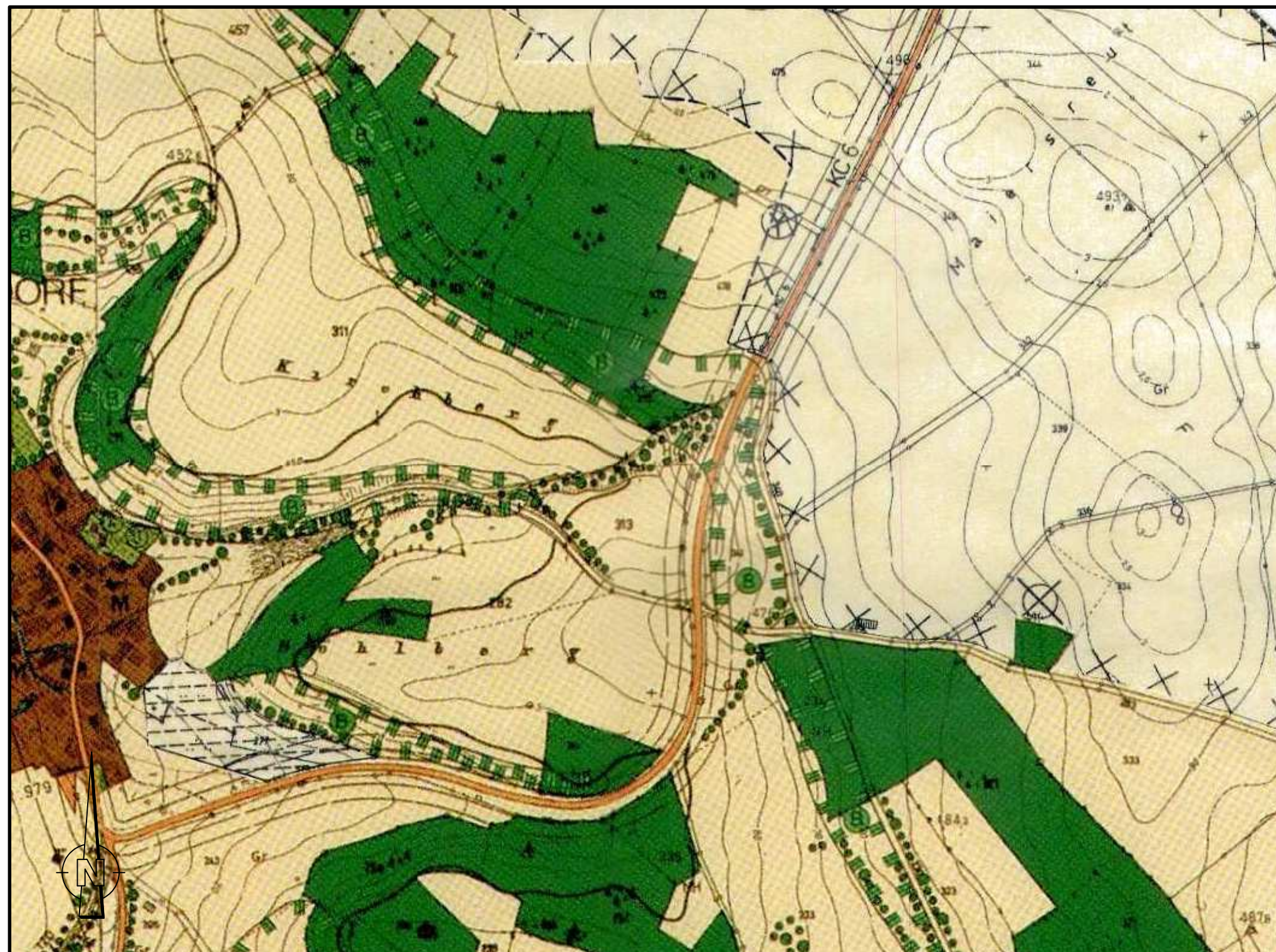
FLÄCHENNUTZUNGSPLAN DER GEMEINDE WEIßENBRUNN (AUSSCHNITT) 1:5000