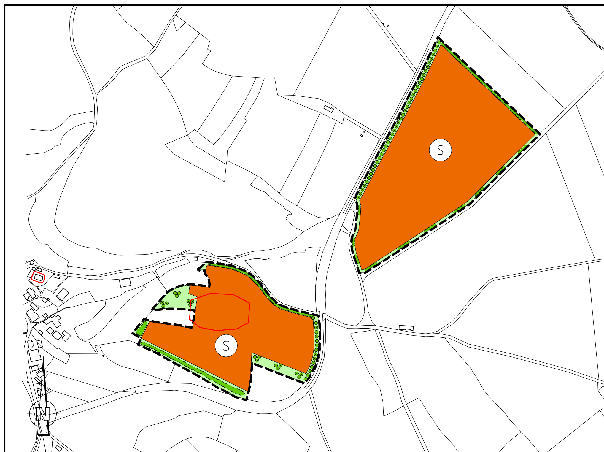
ÄNDERUNG DES FLÄCHENNUTZUNGSPLANES DER GEMEINDE WEIßENBRUNN 1:5000